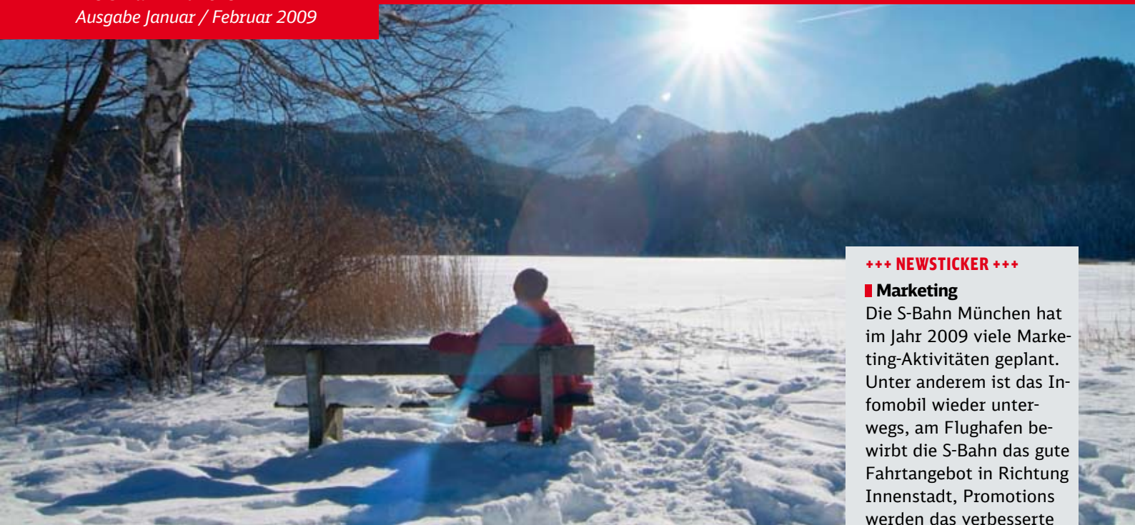
Einsame Stille: Nach einem ausgiebigen Spaziergang erholt sich die Wanderin auf einer Bank und genießt die Sonne.

Die S-Bahn München Ausgabe Januar / Februar 2009