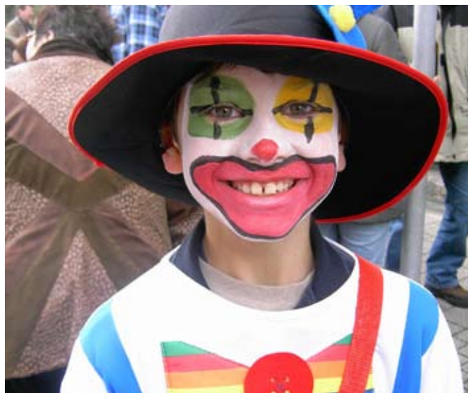
Gute Laune: Der kleine Clown hat im Fasching viel Spaß.

Nach der Faschingsgaudi herrscht naturgemäß Ebbe im Portemonnaie. Um zu zeigen, dass eine Gehaltserhöhung von Nöten ist, versammeln sich traditionell die Münchner am Aschermittwoch, den 25. Februar um 11 Uhr, am Fischbrunnen, um dort ihr Geldsäckel demonstrativ zu waschen. Wie lange diese Tradition existiert, ist nicht eindeutig zu beantworten. Bereits Anfang des 15. Jahrhunderts sollen Münchens Bürger am Aschermittwoch Münzen in den Fischbrunnen geworfen haben.