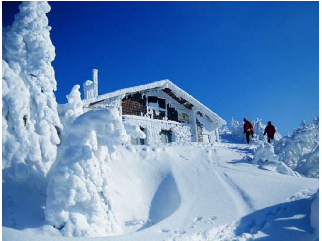
Einkehren und wärmen: Auf den Wanderwegen gibt es viele Möglichkeiten, um sich zu stärken.

Der sieben Kilometer lange Wanderweg ist ein ausgedehnter Spaziergang durch den Erdinger Norden. Die Route führt vom S-Bahnhof Erding über die Dorfener und Landshuter Straße zum Ortsteil St. Paul über die Semptbrücke zur Pfarrkirche St. Martin. Weiter geht es auf