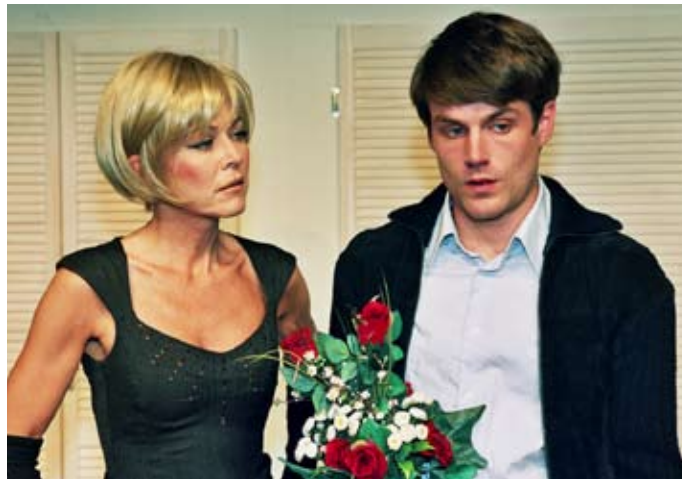
Reifeprüfung: Benjamin Braddock ist hin und her gerissen.