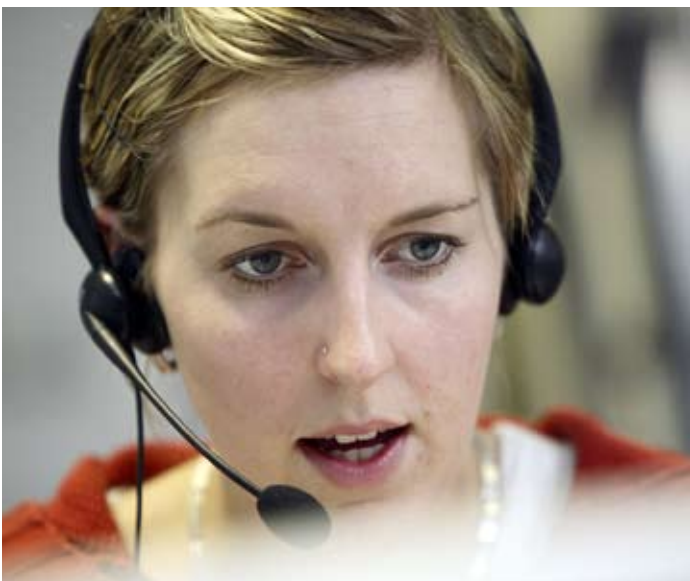
Kundenanzufe: Die Service-Mitarbeiter sind nun besser zu erreichen.

Die Service-Nummer der DB lautet 0180 5 99 66 33 (14 ct/Min. aus dem Festnetz, Mobilfunk ggf. abweichend).