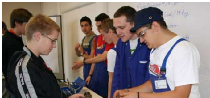
Regio-Tag: Azubis stellen Schülern im direkten Gespräch ihren Ausbildungsberuf vor.

Studium. Duale oder berufsintegrierende Studiengänge geben Abiturienten die Möglichkeit, bei der DB den Grundstein ihrer beruflichen Karriere zu legen, wie mit dem Studium an der Berufsakademie (BA-Studium). Beispiele sind das BA-Studium Dienstleistungsmanagement in Kooperation mit der BA-Stuttgart oder der Studiengang Projekt Engineering an der BA-Mannheim. Bei DB Regio Bayern werden in 2009 über 80 Azubis im gewerblich-technischen Bereich eingestellt, davon allein bei der S-Bahn München 20 Eisenbahner im Betriebsdienst Fachrichtung Lokführer/Transport, sechs Elektroniker für Betriebstechnik und drei Industriemechaniker.