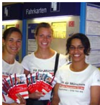
Am Airport: Die Service-Mitarbeiter erwarten die Flugreisenden.

terin Fahrgastkommunikation S-Bahn München. Moderne Ticketautomaten mit einer Einstiegsmaske für den Schnellverkauf sind bereits installiert worden. Zusätzlich erhielten die Automaten eine Sockelbeklebung und es wurde ein übersichtliches Automatentableau installiert. Um die Entwerter für die Fahrgäste besser erkennbar zu machen, erhielten sie neue Aufkleber. Insgesamt stehen am Flughafen fünf Verkaufsschalter, 32 Automaten und 23 Entwerter zur Verfügung. Die S-Bahn plant zudem, an rund 100 Tagen einen exklusiven Beratungsservice einzusetzen. Die freundlichen Promoter empfangen Geschäftsreisende und Touristen bereits im Ankunftsbereich und empfehlen den Flugreisenden das günstigste Single-/Partner-Ticket in die Stadt.