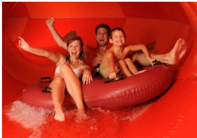
Spaßfaktor: Mit der ganzen Familie das Rutschenparadies genießen.

Im exotischen Thermenparadies erwartet die Gäste in verschiedenen Becken Thermalheilwasser mit Temperaturen von 34 bis 40 Grad Celsius. Das Außenbecken gibt den Blick frei auf den großen Thermengarten. Die aus 2.350 Metern Tiefe geförderte, fluoridhaltige Schwefeltherme wird bei Erkrankungen des Bewegungsapparates, Gelenkschmerzen und zur Regeneration nach Unfall- und Sportverletzungen medizinisch empfohlen. Auch bei Muskelverspannungen und Hauterkrankungen wird ein Bad in der Solgrotte empfohlen. Für Abwechslung und Aktivität sorgen die kostenlosen Aqua-Fitnessprogramme. Die VitalOase bietet Gesundheit und Entspannung für Gäste ab 16 Jahren. Eigene Thermalheilwasserflächen, der Sauerstoffgarten und die Bali Lounge sind dafür reserviert.