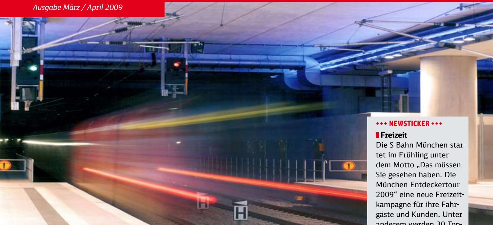
Abfahrt: Die Pünktlichkeit der S-Bahn München ist auch im Jahr 2009 die große Herausforderung.

Die S-Bahn München Ausgabe März / April 2009