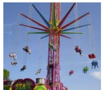
Frühlingsfest: Die Besucher haben in luftiger Höhe viel Spaß.

München. Bereits zum 45. Mal eröffnet das Frühlingsfest der Münchner Schausteller den Reigen der Münchner Volksfestsaison. Die „kleine“ Schwester des Oktoberfestes ist ein Fest mit Spaßfaktor und moderaten Preisen. Auf der Theresienwiese erwartet die Besucher vom 17. April bis 3. Mai 2009 ein umfangreiches Rahmenprogramm, das nicht zuletzt auf die kleinen Gäste zugeschnitten ist. So gibt es zwei Familientage (mittwochs von 11.00 bis 19.00 Uhr) mit ermäßigten Preisen. An zwei Freitagen findet zudem ein Feuerwerk statt, das im Südteil der Theresienwiese abgeschossen wird, so dass alle Besucher des Festes einen guten Blick darauf haben.