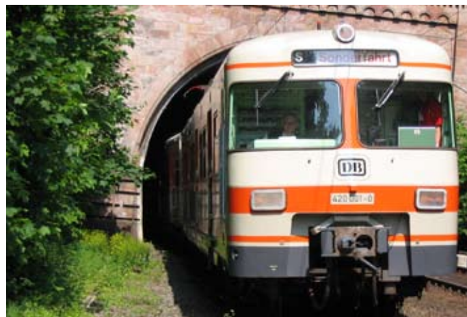
Sonderfahrt: Mit dem historischen Olympiazug rund um München fahren.