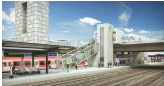
Hirschgarten: Die Animation zeigt, wie der Haltepunkt aussehen soll.