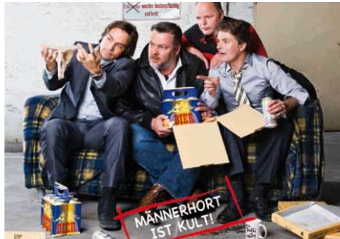
Der Männerhort: Im Heizungskeller haben sich die Männer eingerichtet.