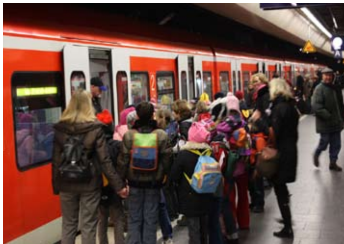
Einsteigen: Die Fahrgäste sollen nicht nur eine, sondern alle Türen nutzen.

Takt und somit den Fahrplan exakt einzuhalten. Verzögerungen beim Ein- und Ausstieg führen sehr schnell zum bekannten Domino-Effekt im gesamten S-Bahn Netz, denn eine verspätete S-Bahn gibt auf der Stammstrecke die Verspätung auf die folgenden S-Bahnen weiter. „Wir bitten unsere Fahrgäste, insbesondere im Berufsverkehr aktiv zur Pünktlichkeit beizutragen“, so Frank Hole, Marketingleiter der S-Bahn München. „Drei Punkte sind ganz wichtig: Bitte nutzen Sie alle zur Verfügung stehenden Türen zum Einstieg. Bitte gehen Sie ins Wageninnere durch und beachten Sie die Ansage `Zurückbleiben bitte`.“ Gewaltames Aufhalten oder Öffnen der Türen führt zu Verzögerungen oder gar langwierigen Störungen.